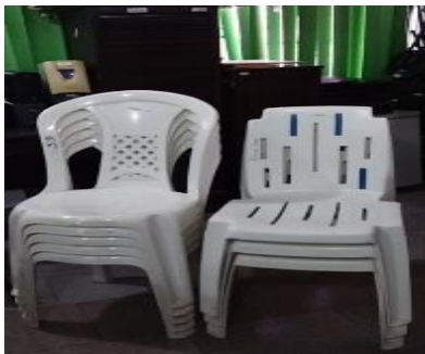
50 - 08 CADEIRAS PLASTICAS