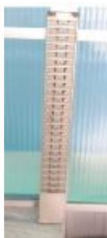
21- PORTA CARTÃO PARA PONTO