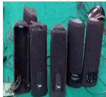
27- 03 PARES DE CAIXAS DE SOM PARA CPU