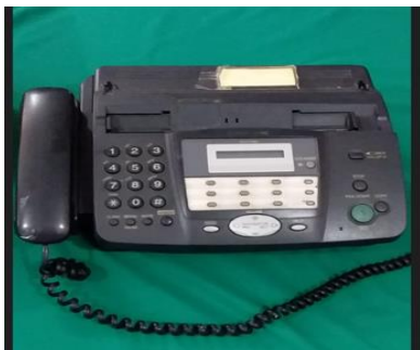
17- APARELHO DE FAX PANASONIC KXFT 901