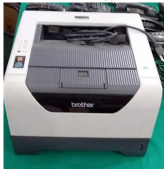
18- IMPRESSORA BROTHER MODEL-HL-53