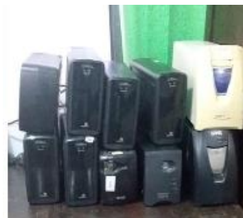
31- 10- NOBREK - STABILIZADORES