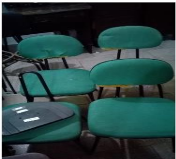
49- CADEIRA FIXA ESTOF. EM TECIDO VERDE C/ ESTRUT. FERRO