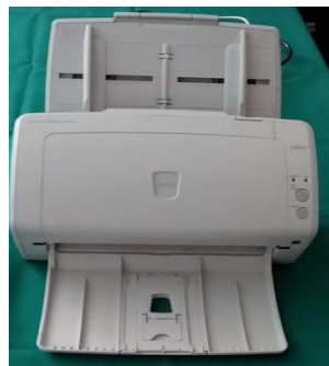
22- SCANNER- CFESS P/ EMISSÃO DO DIP