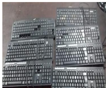
30- 07 TECLADOS DIVERSOS