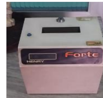
20- RELÓGIO DE PONTO HENRY, FORTE