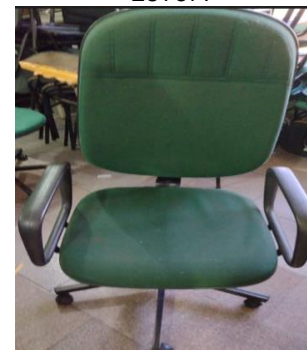
23- POLTRONA TIPO DIRETOR GIRAT. ESTOF.