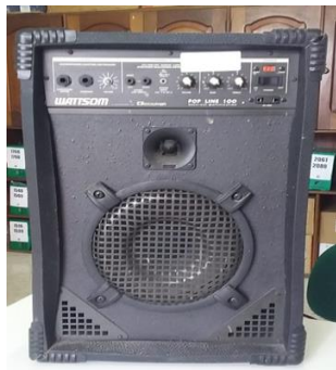
25- CAIXA DE SOM AMPLIFICADA POP LINE 100 WT.