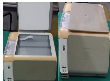
19-IMPRESSORA HP F4180